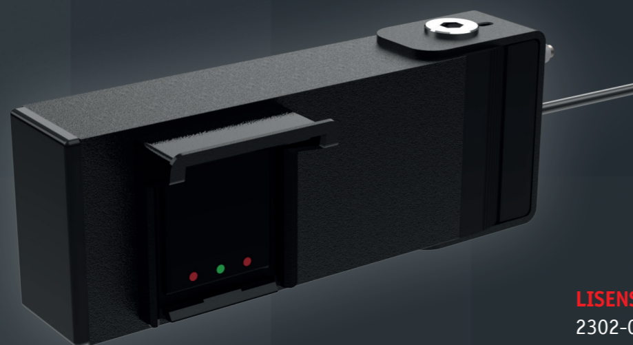
LISENS scan SUC3-1240E * 2302-0311